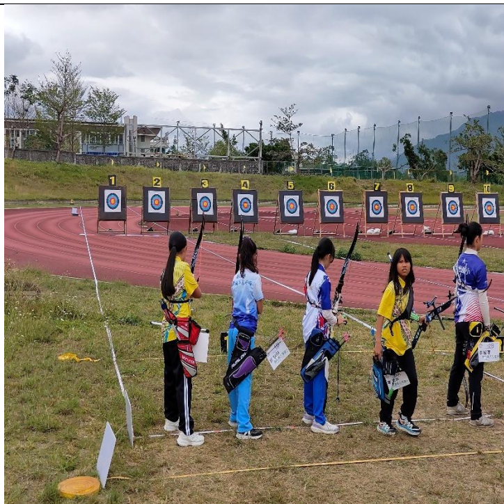
說明：114 全國青年盃暨花蓮太平洋射箭錦標賽