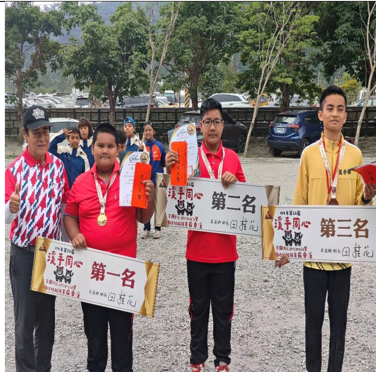
說明：114 年全國布農族運動會